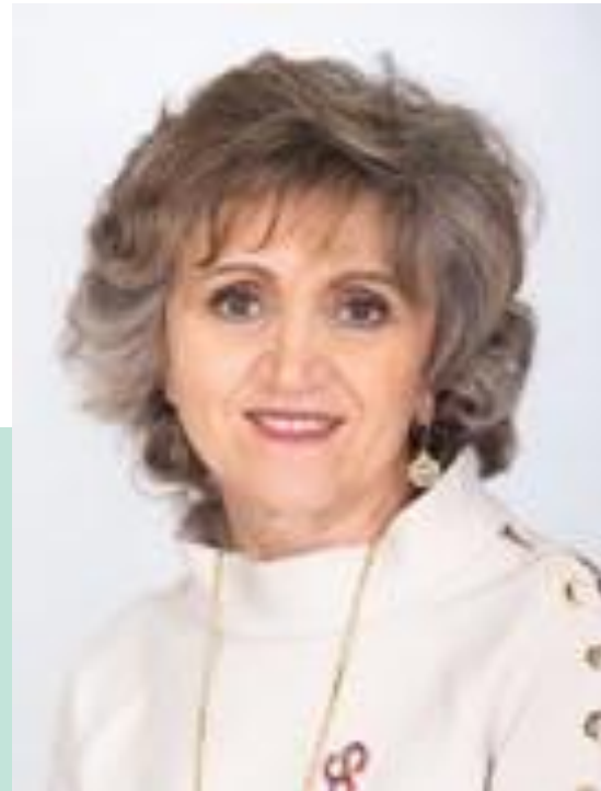
Maria Luisa Carcedo

Licenciada en Medicina y Cirugía por la Universidad de Oviedo. Diplomada en Medicina del Trabajo. Actividad profesional en Atención Primaria de Salud. Senadora por designación de la Junta General del Principado de Asturias Alta Comisionada contra la Pobreza Infantil. Ministra de Sanidad, Consumo y Bienestar Social. Además ha ocupado cargos como: Vocal de la Diputación Permanente, Adscrita de la Comisión de Transportes, Movilidad y Agenda Urbana, Vocal de la Comisión de Derechos Sociales y Políticas Integrales de la Discapacidad, Adscrita de la Comisión de Agricultura, Pesca y Alimentación, Presidenta de la Comisión de Política Territorial, Vocal de la Comisión de Sanidad y Consumo.